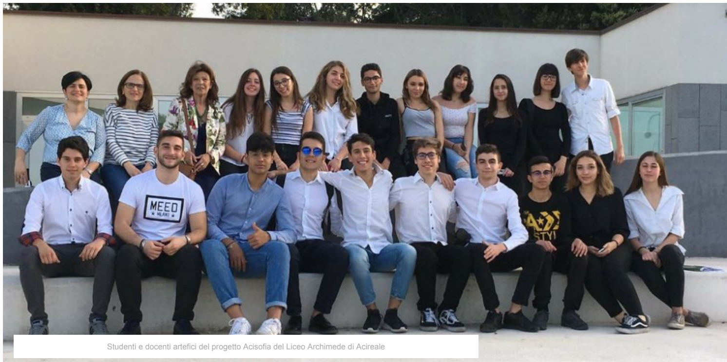
Studenti e docenti artefici del progetto Acisofia del Liceo Archimede di Acireale

Gli studenti del liceo acese Archimede, hanno approfondito Platone, Agostino, Moro, Campanella, filosofi accomunati dalla ricerca di un mondo altro possibile che per i giovani alunni si è sostanziato nel progetto di una città ideale. Nell'acronimo gli studenti hanno individuato otto elementi peculiari (Art, Community, Innovation, Responsibility, Economy, Architecture, Landmark, Ecology) per una cittadina vivibile e a misura d'uomo