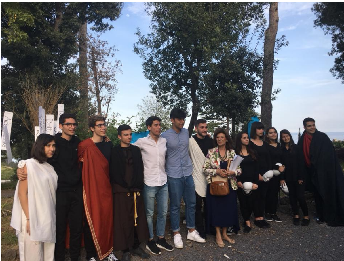
Un altro scatto di gruppo degli studenti e dei docenti del Liceo Archimede di Acireale durante lo svolgimento di Arcisofia, festival della filosofia

Un pomeriggio in cui la filosofia si è davvero fatta attualità e scoperta di mondi possibili con l'Agorà a più voci, durante la quale i ragazzi hanno intervistato alcuni illustri ospiti (Mons. Antonino Raspanti, vescovo della Diocesi di Acireale, il professore Rosario Faraci della Facoltà di Economia dell'Università di Catania, il magistrato Francesca Pricoco, presidente del Tribunale dei Minorenni di Catania e il prof. Paolo Guarnaccia, docente di Agronomia e Coltivazione erbacee dell'Università di Catania), seguita dagli accattivanti giochi filosofici sulla scia di passeggiate filosofiche, condite dalla lettura di passi d'autore, per culminare nella rappresentazione teatrale del mito di Aci e Galatea, a cura di Carola Colonna, attrice e già insegnante di storia e filosofia al Liceo Archimede.